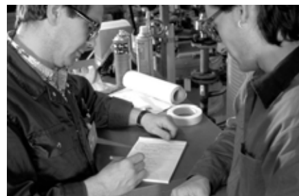
Fig. 8: occorre un'autorizzazione scritta per i lavori di saldatura se non si può escludere totalmente il rischio di incendio o di esplosione.