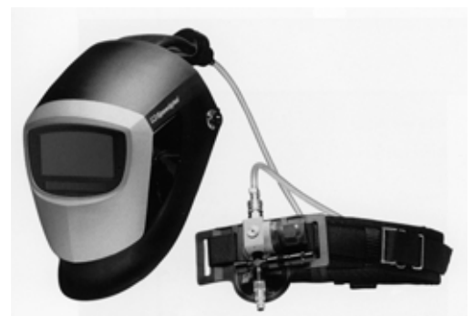
Fig. 4: durante le operazioni di taglio termico o riscaldamento a fiamma in ambienti ristretti o scarsamente ventilati (ad es. serbatoi, condotte) bisogna utilizzare un respiratore ad adduzione di aria compressa completo di elmetto da saldatore.