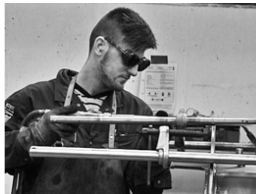
Fig. 5: addetto alla saldatura a gas durante la finitura. Indossa occhiali di protezione (classe di protezione 4-7 secondo EN 169) e protettori auricolari.

Possibili misure: indumenti di protezione per saldatura, calzature di sicurezza e ghette per saldatura, guanti da saldatore, occhiali da saldatore, casco o schermo da saldatore