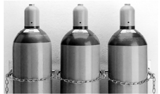
Fig. 1: bombole a gas tenute ferme da una catena.