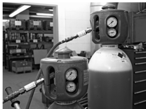
Fig. 6: bombole in acciaio con cappuccio di protezione e riduttore di pressione integrato, regolatore di pressione, indicatore del contenuto di gas e dispositivo di sicurezza