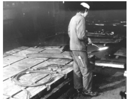
Fig. 2: arrotolamento corretto di tubi a fianco del posto di lavoro per evitare di inciampare.