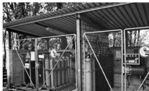
Fig. 7: misure di protezione antiesplosione su una rampa di raccordo all'aperto per bombole a gas o batterie di bombole a gas infiammabili (buona ventilazione naturale, zona-ex 1).